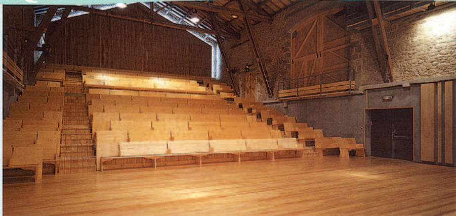
▲ Les aménagements entièrement en bois favorisent des performances acoustiques de haut niveau.